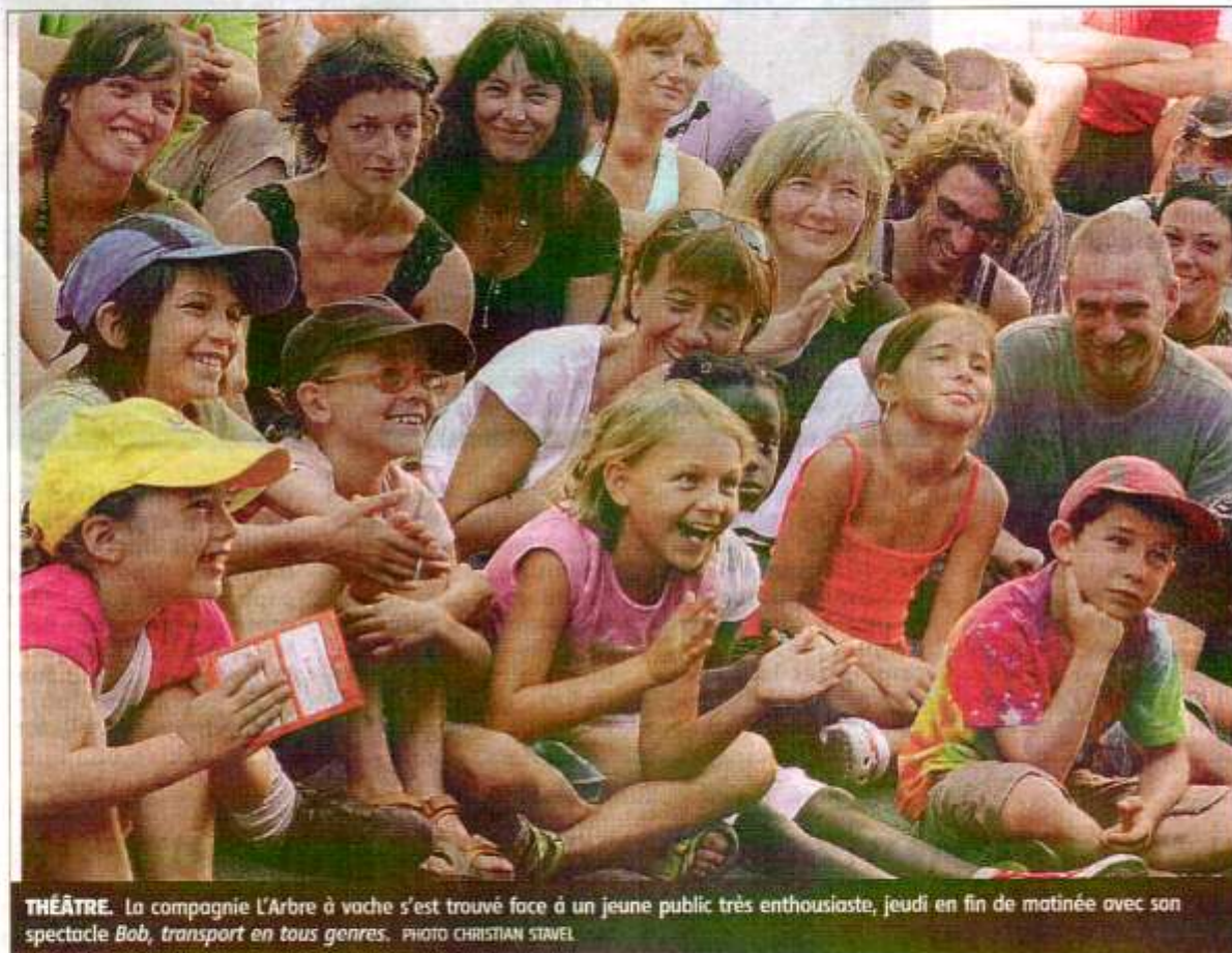
THÉÂTRE. La compagnie L'Arbre à voche s'est trouvé face à un jeune public très enthousiaste, jeudi en fin de matinée avec son spectacle Bob, transport en tous genres .

Des spectacles adaptés aux enfants comme aux parents